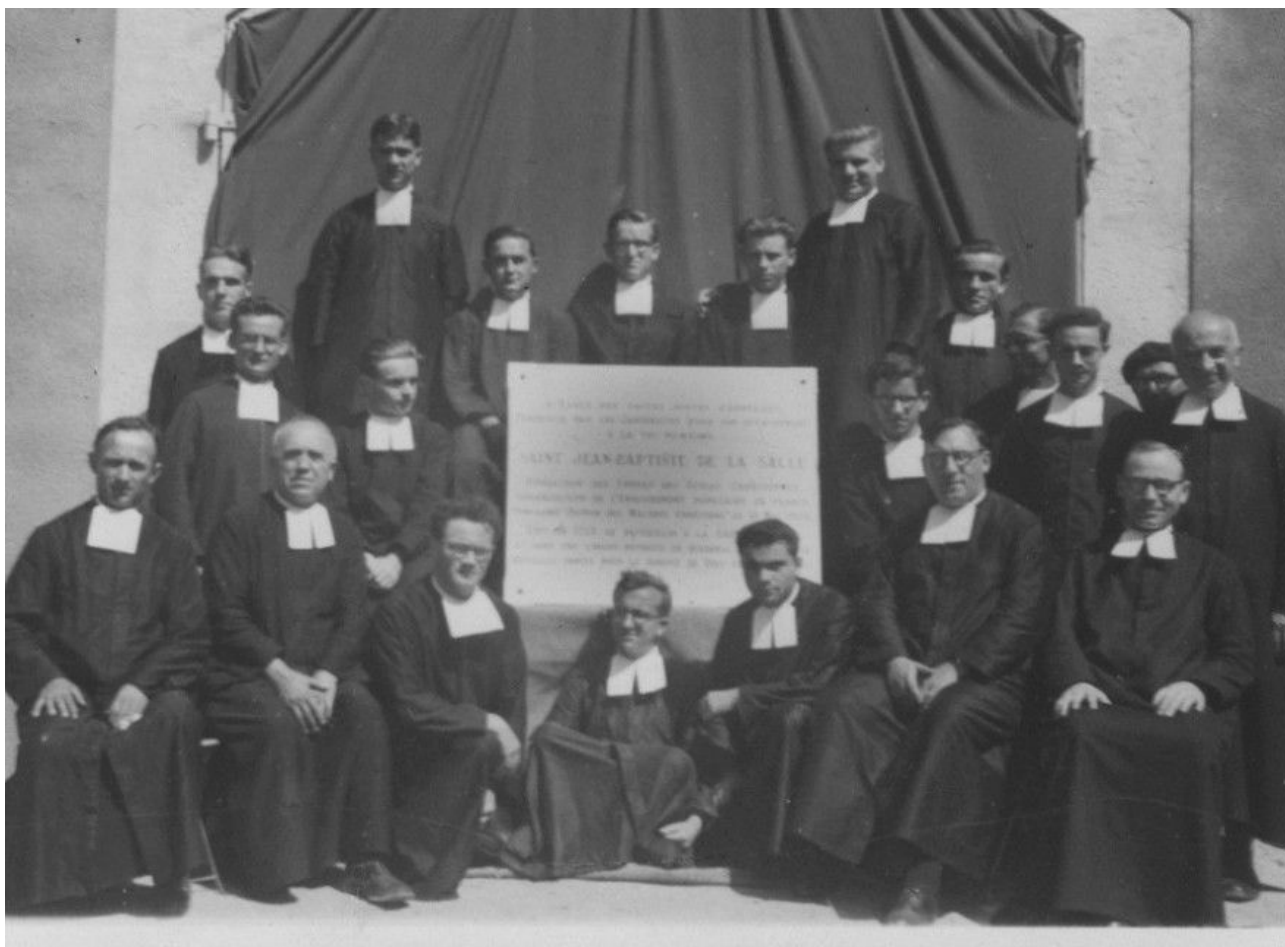
Photo : « Frères du District de Provence, à la Sainte-Baume, 9 septembre 1950, inauguration de la plaque commémorative, Archives de la Maison Généralice, Rome, cote BJ505. »

« Accablé par toutes sortes d'épreuves, persécuté par les jansénistes pour son attachement à la foi romaine, saint Jean-Baptiste de La Salle, Fondateur des Frères des Écoles chrétiennes, organisateur de l'enseignement populaire en France, proclamé « Patron des maîtres chrétiens » le 15 mai 1950, vint en 1713, se recueillir à la Sainte-Baume, et dans une longue retraite de quarante jours, puiser de nouvelles forces pour le service de Dieu et de l'Enfance ».