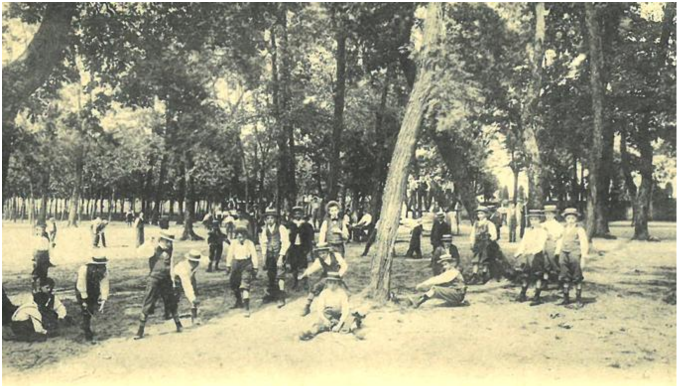
PENSIONNAT J.-B. DE LA SALLE, Bordeaux-St-Genès. — Récréation au Petit-Bois.